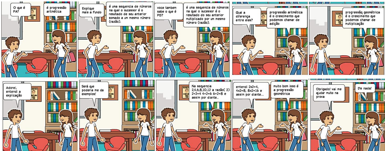
Figura 2. HQ de Matemática sobre PA e PG.